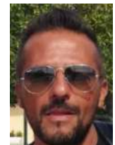
Nino Referente infermieristico