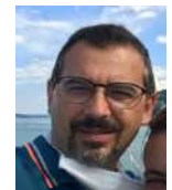
Marco Referente Reparto